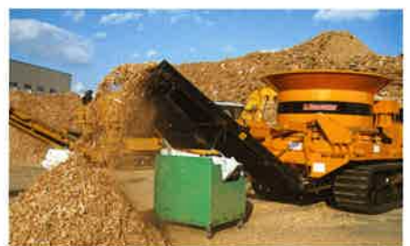
MC-6000 廃ペレット・型枠