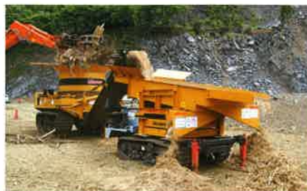
MC-2000→ふるい機 (MRS-24) 雑木