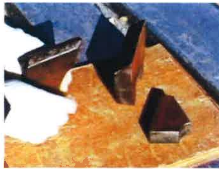
溶接にて交換可能な為、経済的。