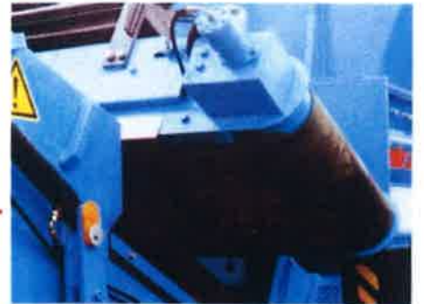
廃材より分離された金属を強力に除去。下の写真は磁選機により除去された金属類。