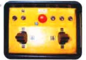
投入オペレーター一人で全操作可能