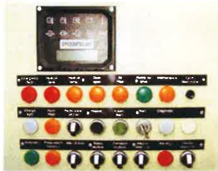
コンピューターによる完全自動制御。