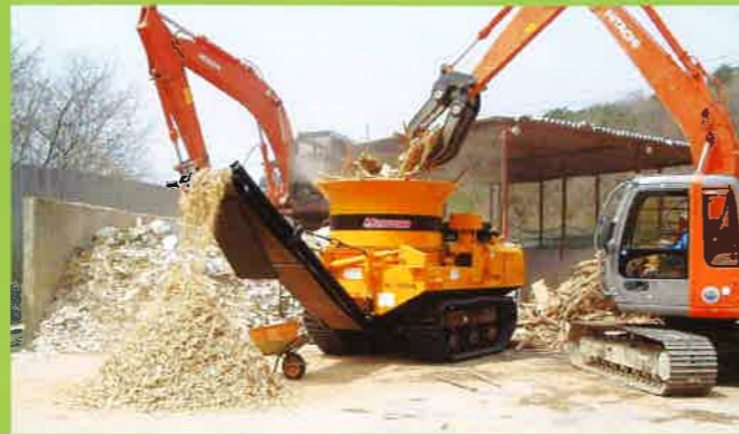
MC2000 中間処理⇒ボード・燃料チップ