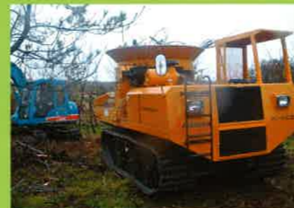
MC2000 県森運⇒松食い木破砕・マルチング材