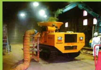
MC1500 葛飾区リサイクルセンター⇒マルチング