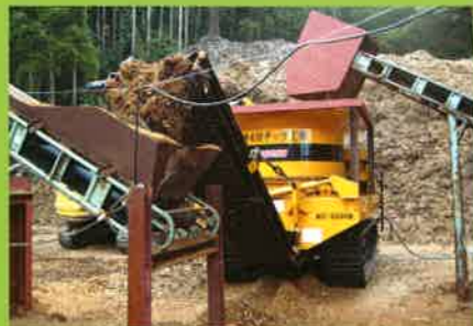
MC2000 製材業⇒パーク(木の皮)・燃料チップ