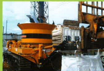
MC2000 バンバー・硬フラ⇒燃料・減容