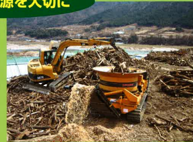
MC6000 ダム流木⇒敷材・マルチング