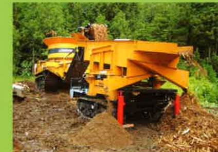
MC2000 直接選別⇒敷材・燃料チップ