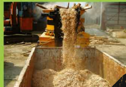
MC2000 解体業⇒梁・柱 燃料・製紙用チップ