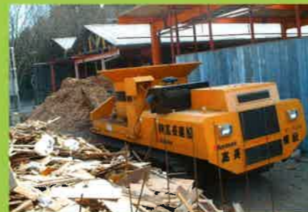
MC4000 型枠材⇒家畜敷材・燃料チップ