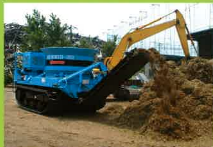
MC4000 草の破砕⇒堆肥・家畜敷材