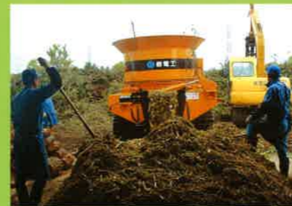
MC2000 電力関連剪定枝⇒堆肥