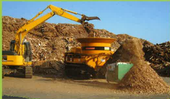
MC6000 製紙関連⇒燃料チップ