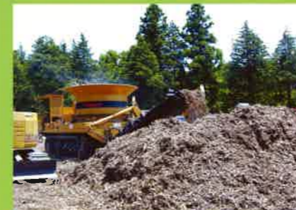
MC6000 レンタル業⇒現場破砕・燃料チップ