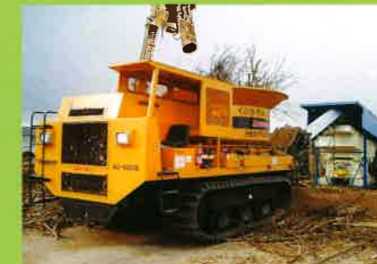
MC6000 森林組合⇒草防止材・敷材・堆肥