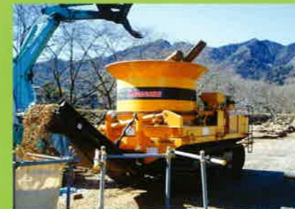
MC2000 ダム流木・伐採木⇒林道用クッション材